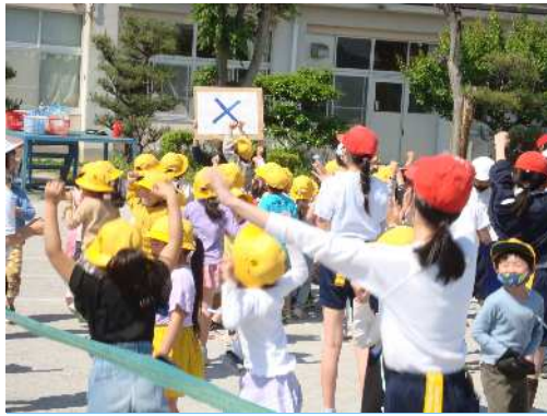
5月9日(火)1年生と遊ぶ会 6年生が企画した○×ゲームやしっぽとりを行いました。