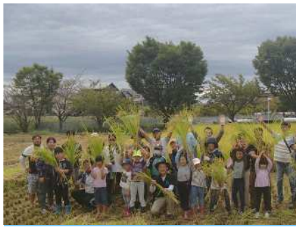
10月1日（日）おやじの会・PTA共催稲刈り体験 上重原農地改善組合の皆様のご協力のもと、貴重な体験ができました。