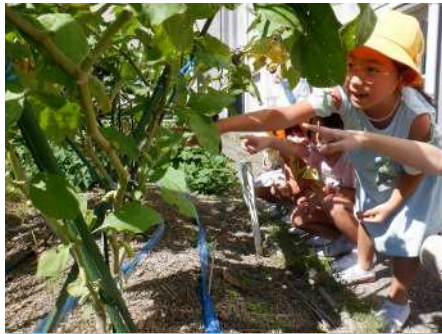
9月29日（金）2年生活科野菜の観察 2年生の教材園は、野菜が大きたくさん育ちました。