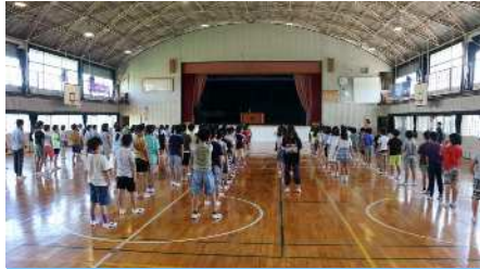
9月1日（金）全校朝会 さあ今日から学校です。3, 4年生が体育館に入り、しっかりお話を聞きました。