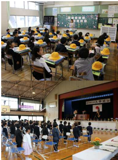
4月6日(木) 入学式 入学おめでとうございます。花のような笑顔の1年生が63名、猿渡っ子の仲間になりました。