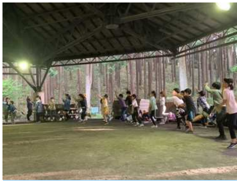
7月10日（月）5年生山の学習④ 1組のスタッツ