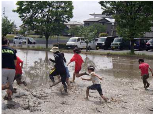
5月6日(土)第1回どろんご運動会 天気にも恵まれ無事に開催することができました。泥まみれになりながら楽しそうに走り回っていました。