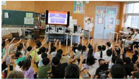
9月6日（水）3年PTA学年全体会「スマホ・ケータイ安全教室」 とても便利なスマホの安全な使い方を親子で学びました。