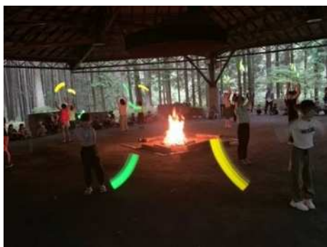
7月10日(月)5年生山の学習⑦ たくさん練習した光の舞です。