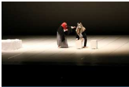
10月27日（金）子どもアートふれあい事業「赤ずきん」 今年も全校でパティオに出かけ、素敵な劇を鑑賞しました。