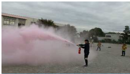
11月9日（木）3年生防火教室 消防署の方に来ていただき、3年生が火災の防止と対応について勉強しました。