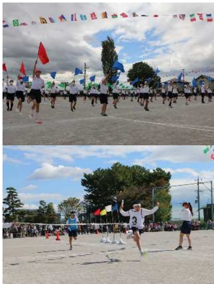
10月21日(土)5・6年生運動会 より迫力のあるリレーと高学年の団結を発揮する旗運動を行いました。 仲間と団結して完成させた旗運動は、高学年としての迫力とピタリそろった旗の動きに感動しました。