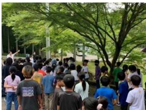
7月10日(火)5年生山の学習① 5年生が元気に山の学習に出発しました。センターも晴れですが、木陰は涼しいです。