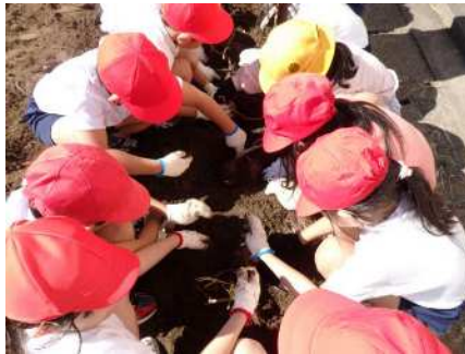
10月30日（月）1年生生活科芋ほり 教材園に植えたお芋が育ちました。1年生みんなで掘り出しました。