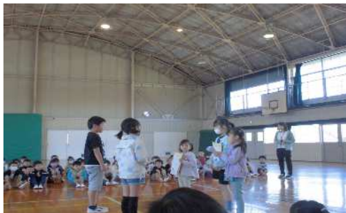
4月27日(木)1・2年生交流会 2年生から歌とアサガオの種をプレゼントしました。また、手をつないで学校を案内して回りました。