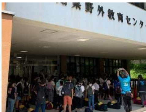
7月10日（月）5年生山の学習② 入所式を行いました。明日の11：00ごろまでここでお世話になります。