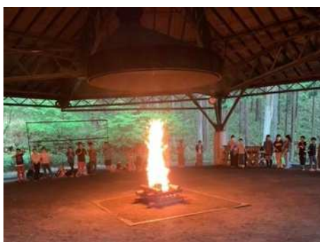
7月10日(月)5年生山の学習⑥ いよいよ点火です。