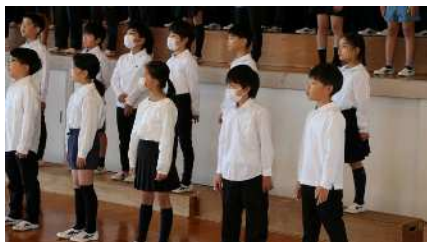
10月30日（月）小学校音楽会リハーサル（全校朝会） 11月2日の本番に向け、3年生はたくさん練習しています。今日は体育館で美しい歌声を聞かせてくれました。