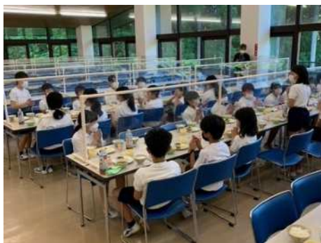
7月11日(火)5年生山の学習⑧ 朝起きて、元気に朝食をいただいています。