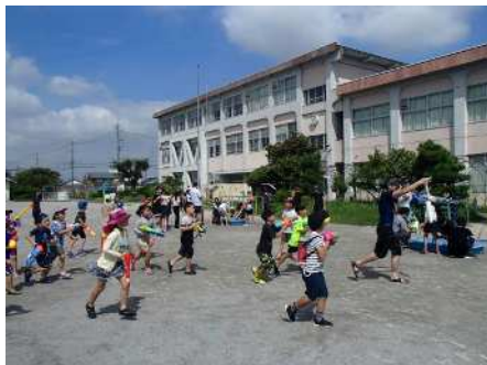
8月19日（土）おやじの会・PTA共催「水鉄砲大会」 暑い日でした。みんなでびしょぬれになって楽しみました。