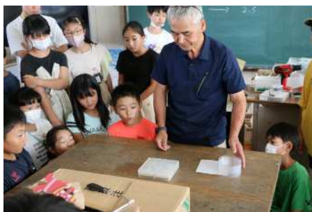
9月27日（水）5年糸鋸特別授業 木工細工の達人がまた指導に来てくれました。写真は、回転するこまを宙に浮かせて見せてくれているところです。