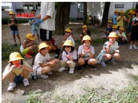
8月18日（金）全校出校日 2年生が生活科で育てたスイカが立派に実りました。出校日に、みんなで食べました。