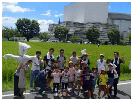
8月26日（土）おやじの会・PTA共催「かかしづくり」 5月に田植えをした田んぼに稲穂が輝いています。わらと竹を使ってかわいいかかしをたくさん作りました。