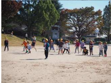
10月31日（火）1・2年生遠足 待ちに待った遠足です。10月末だけど暖かく、みんなで元気に遊びました。お弁当も、おいしく楽しくいただきました。