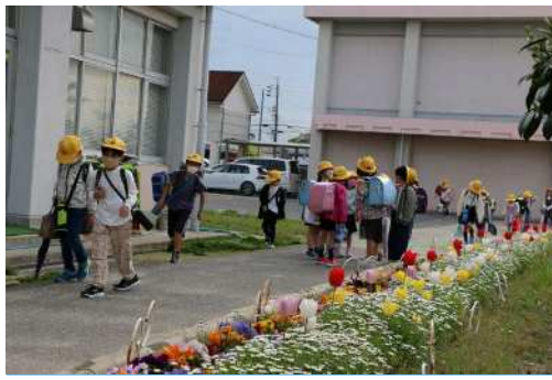
4月11日(火)登校風景 花いっぱいの花壇の横に登校しています。猿渡小は花盛りです。