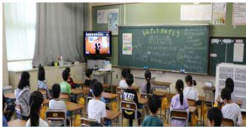
4月6日(木) 始業式 進級おめでとうございます。2年生以上は、教室で始業式を行いました。