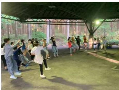
7月10日(月)5年生山の学習⑤ 2組のスタンプ