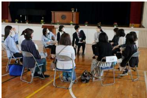
4月21日(金)PTA全委員会 授業参観の後、PTA専門委員会・学年委員会を一齐に行いました。1年間の活動計画が決まりました。委員の皆様、1年間よろしくお願ひします。