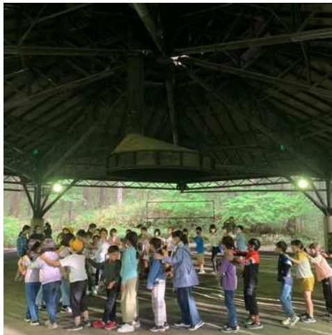
7月10日（月）5年生山の学習③ 予定通り18：00からキャンプファイヤーを始めました。雨が上がって明るくなりました。じゃんけん列車をしています。