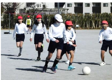
5年サッカー指導会(3、5日)