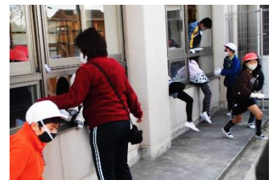
問題解決型防災訓練(9日)