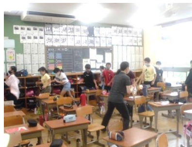
【クラスでの不審者対応訓練】

今後も問題解決的な防災・防犯訓練を定期的に行い、「自分の命は自分で守る」意識を高める児童、「豊かでよりよい人生を切り開く」児童の育成を目指していきます。