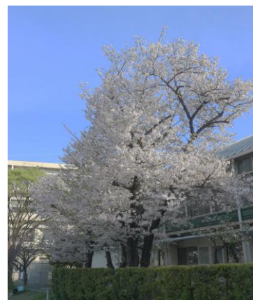
今年も体育館裏の桜がきれいに咲きました

知立西小学校の電話回線は2回線しかありません。朝の欠席等の連絡につきましては、できるだけ電話を控えていただき、8時までに「きずなネット」でお知らせいただくとたいへん助かります（緊急などを要する場合を除く）。 どうかご協力のほど、よろしくお願いいたします。