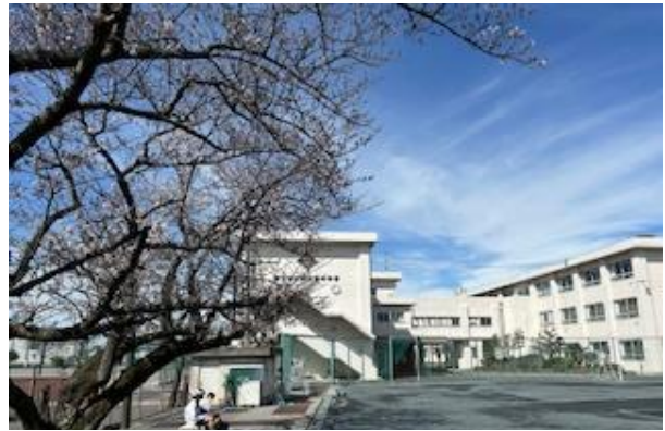
【令和 6 年 4 月 4 日南中正門サクラ】