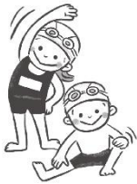
じゅんぶうんどう