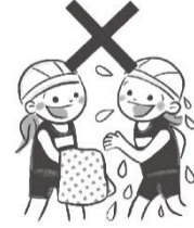
タオルの貸し借りは