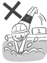
とびこみはしません!