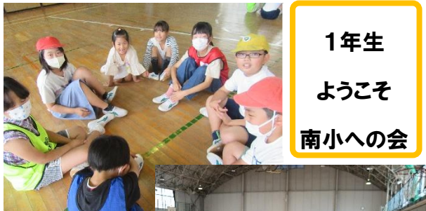
1年生 ようこそ 南小への会

使用後は、パレットを新聞紙で包み、持ち帰ります。学校では全員分のパレット、筆洗容器、筆を洗えませんので、持ち帰ったら、必ず、ケースから取り出し、パレット、筆洗容器、筆をきれいに洗い、乾かして保管してください。