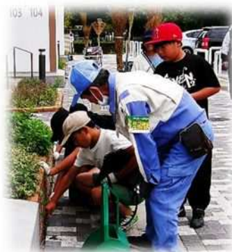
クリーンメイトさんとともに活動する子どもたち

10月21日（火）午後、本校4年生の子どもたちは、総合的な学習の時間の一環で、知立団地内で清掃活動を仕事にしている日本総合住生活株式会社の「クリーンメイト」の方とともに清掃活動を行ったり、インタビューをしたりしました。4年生は、5月からこれまで「東っ子クリーン大作戦」をテーマに、環境について学習しています。校内で汚れた箇所を調査することから始め、その箇所を分担して掃除したり、そのための道具を自分たちなりに工夫して作ったりしてきました。活動を重ねるうちに、一番身近な「知立団地を実際に掃除している方に話を聞いてみたい」という声が、子どもたちから挙がりました。