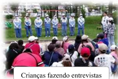
Crianças fazendo entrevistas