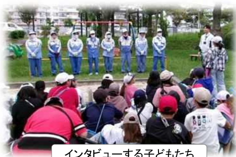
インタビューする子どもたち

今回の体験を通して、身の周りをきれいにしようとする気持ちだけでなく、地域のために活動している方の思いや努力を感じ取り、感謝の気持ちをもって今後の活動に生かしていこうとする姿に大きな成長を感じました。今後も、地域や周りの人との関わり合いから学ぶ機会を他学年でも展開していきたいと思います。