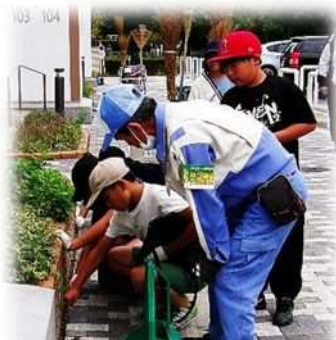
Crianças fazendo as atividades junto com o pessoal da “Clean mate”

Através dessas experiências, senti que os alunos cresceram significativamente, não só na vontade de limpar ao seu redor, mas também em perceber as opiniões e esforços das pessoas que trabalham em função da comunidade e se sentir gratos com isso. Espero poder continuar, proporcionando oportunidades para que as outras turmas, também possam aprender por meio das interações com a comunidade e as pessoas ao seu redor.