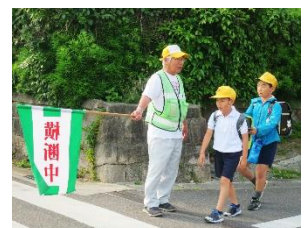
【あんしんサポート隊 H30】