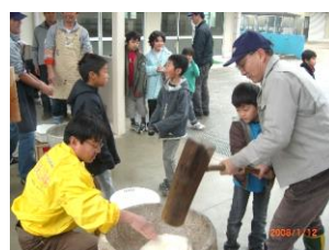
【おやじの会 H20 餅つき】

あんしんサポート隊は平成18年3月に結成され、それ以降、毎日登下校の見守りをしてくださっています。また、年に1回、総会を開き、通学路の安全確保について話し合いをしています。