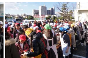
あんしんサポート隊総会