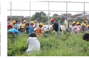
親子除草・トイレ掃除