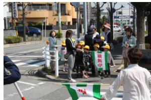
新入生交通安全教室