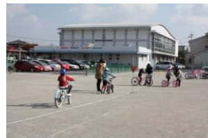
2年生自転車乗り方教室