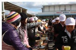
マラソン大会おしるこ会