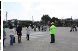
立番指導者講習会 (地区連絡員)